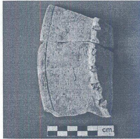
Ejemplar del Tipo Cerámico Camarón Inciso Pestaña Mellada

Zoila Yolanda Calderón Santizo Zoila Yolanda Calderón Santizo